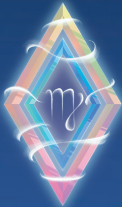
ДЕВА ( 24 АВГУСТА – 22 СЕНТЯБРЯ )

Звезды предупреждают – вы будете много нервничать, а это – лишнее. В стрессе тяжело ясно думать и быстро соображать, да и делу такое состояние ничем помочь не способно. Лучше возьмите себя в руки и преодолите кризисную ситуацию. В этом вам не помогут аргументы или логичные доводы – придется проявить понимание, доброту и сердечную мягкость. Тогда от конфликта не останется и следа.