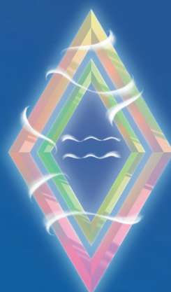
ВОДОЛЕЙ ( 21 ЯНВАРЯ – 19 ФЕВРАЛЯ )

Находите баланс между личной жизнью и делами! Декабрь вас ждет активный и, вероятно, напряженный – много дел вам предстоит переделать в этом месяце! И как все успеть? Грамотное планирование и четкое следование режиму дня – так звучит рецепт успеха. Если у вас еще нет ежедневника (органайзера), самое время им обзавестись.