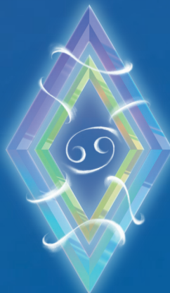
РАК ( 22 ИЮНЯ – 22 ИЮЛЯ )

Живите с уверенностью, что все получится! Стремление во всем быть лучшими и первыми пробудят в вас планеты в декабре. Приложив определенные усилия, вы наверняка этого добьетесь. Более того, лавры вам уготованы там, где вы на них даже не рассчитываете. Принимайте похвалу и комплименты, но не зазнавайтесь.