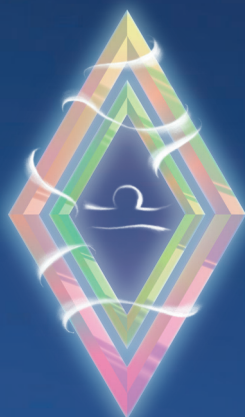
ВЕСЫ ( 23 СЕНТЯБРЯ – 22 ОКТЯБРЯ )

Звезды предупреждают – вы будете много нервничать, а это – лишнее. В стрессе тяжело ясно думать и быстро соображать, да и делу такое состояние ничем помочь не способно. Лучше возьмите себя в руки и преодолите кризисную ситуацию. В этом вам не помогут аргументы или логичные доводы – придется проявить понимание, доброту и сердечную мягкость. Тогда от конфликта не останется и следа.