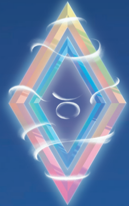
ТЕЛЕЦ ( 21 АПРЕЛЯ – 21 МАЯ )

Зимой звезды рекомендуют вам не спешить с принятием решений, если внутренний голос подсказывает подумать о чем-то другом. Также заранее подумайте о подарках для близких людей. Отложите некоторую сумму, чтобы потом не занимать финансы у коллег или друзей. Мечты имеют свойство сбываться – в этом однозначно убедится Овен. Особенно, когда получит неожиданную прибыль и купит то, что уже давно рассмотрел.