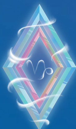
КОЗЕРОГ ( 22 ДЕКАБРЯ – 20 ЯНВАРЯ )

Стрельцы в декабре ощутят подъем сил – у вас откроется «второе дыхание», благодаря которому вы сможете завершить начатые дела и проекты, а также подготовиться к праздничным дням и каникулам. Однако предстоящий декабрь – не лучшее время для начала чего-то нового как в профессиональном плане, так и в отношении личной жизни. Постарайтесь подготовиться к наступлению нового года, а свежие идеи и планы отложите до следующего месяца.