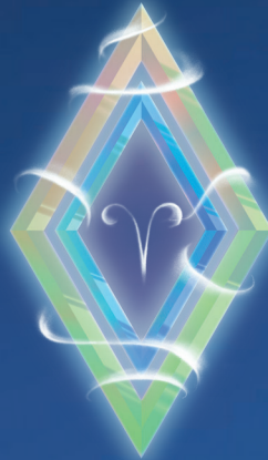
ОВЕН ( 21 МАРТА – 20 АПРЕЛЯ )

Зимой звезды советуют сменить декорации. Когда закрывается одна дверь, открывается другая. Какие-то двери в декабре закроются перед вами, какие-то вы закроете сами. Первый месяц зимы – время попрощаться с тем, что отжило, перестало радовать, и сделать шаг навстречу чему-то новому: делу, хобби, любви, дому!