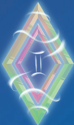
БЛИЗНЕЦЫ ( 22 МАЯ – 21 ИЮНЯ )

Живите в настоящем, но и думайте о будущем! В декабре звезды советуют вам сделать эту фразу своим девизом. Давать вам Вселенная действительно будет много: и материальные блага, и знакомства с замечательными людьми, и теплые встречи со старыми друзьями. Принимайте эти подарки, не забывая мысленно посылать в космос слова благодарности. Вы же знаете, что энергия благодарности – одна из самых сильных?.