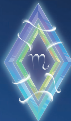
СКОРПИОН ( 23 ОКТЯБРЯ – 21 НОЯБРЯ )

Доверяйте снам и предчувствиям! В декабре очень важно слушать свое сердце и поступать в согласии с ним. Не всегда это будет просто: ответ, идущий изнутри, может казаться глупым и абсурдным! Но вы ошибаетесь. Поживите с ним день-другой, и вы поймете, что услышанное – именно то, что вы хотите, и то, что вам сейчас нужно.