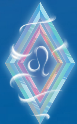
ЛЕВ ( 23 ИЮЛЯ – 23 АВГУСТА )

Дайте прошлому окончательно уйти из вашей жизни! Вы, Раки, склонны лелеять воспоминания – как плохие, так и хорошие: мечтать и фантазировать, и в своих фантазиях отправляться в прошлое, чтобы снова пережить какие-то события, иногда, чтобы их переписать. Звезды призывают отпустить то, что уже ушло. Поставить точку и начать новую главу своей жизни. Вот увидите: она будет куда интереснее и увлекательнее!