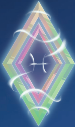
РЫБЫ ( 20 ФЕВРАЛЯ – 20 МАРТА )

НАСТУПАЕТ САМОЕ ВОЛШЕБНОЕ ВРЕМЯ ГОДА – ЗИМА! ДЕКАБРЬ СУЛИТ ЗНАКАМ ЗОДИАКА МНОГО ХОРОШЕГО, ЧТО НЕ МОЖЕТ НЕ РАДОВАТЬ. ВРЕМЯ ЗАВЕРШАТЬ ДЕЛА И ДУМАТЬ О ПЛАНАХ НА ГРЯДУЩИЙ ГОД.