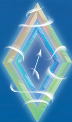
СТРЕЛЕЦ ( 22 НОЯБРЯ – 21 ДЕКАБРЯ )

Этой зимой выходите за рамки собственных представлений о жизни! К вам придет осознание, что вы можете получить гораздо больше того, что имеете на данный момент: денег, славы, любви, друзей – чего угодно! В вас проснутся внутренние силы, появится много идей, как достичь желаемого, дело за малым – их реализовать! С этим тоже проблем не будет: гороскоп более чем благоприятный!